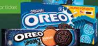
OREO Halloween 154 g